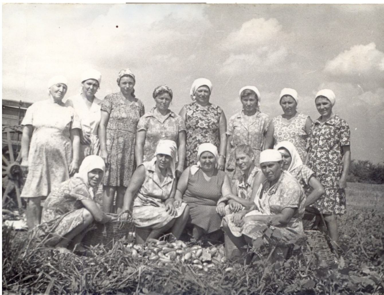
Бригада овощеводов, работающих на огороде колхоза имени М. Горького, все дети войны.