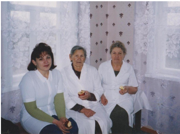
2015 год последний год работы в Богоявленском ФАПе.