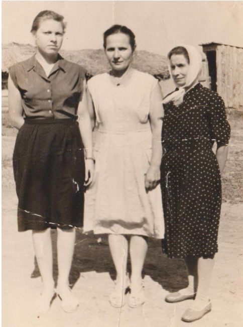
1957 год начало трудовой деятельности